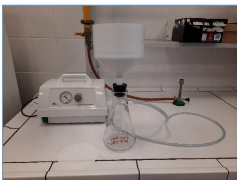
Zestaw do sączenia próbek (pompa próżniowa, kolbka ssawkowa, lejek, sączki celulozowe)